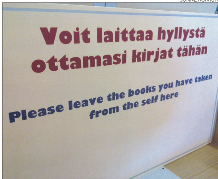
Oulun yliopiston kirjastossa asiakkaita pyydetään ystävällisesti jättämään itsestä (from the self) otetut kirjat tähän.

Japanilainen r-äänne taas on selvästi tremulantti eli tärisävä. Näiden kirjainten sekoitta-