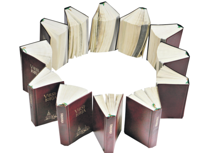
Kymmenen eniten ääniä saanutta tähtivirttä veisataan perjantain tilaisuudessa Oulun tuomiokirkossa.